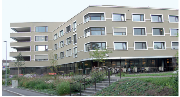
Das Mülrikafi bietet Sitzplätze auch im Garten.