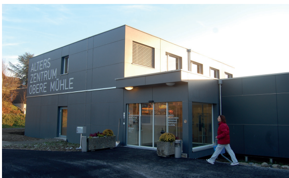
Im Provisorium auf der Baumannsmatte war die Lebens- und Wohnqualität besser als vorher.

Weil zugunsten des Neubaus das bestehende Gebäude abgebrochen werden musste, brauchte es für die Bewohner in der Zwischenzeit ein Provisorium, um während der gesamten Zeit den Weiterbetrieb zu gewährleisten. Sobald der Neubau bezogen wurde, sollte das Provisorium wieder abgebaut werden. Dagegen gab es im Vorfeld verschiedene Einwände: Die Freisinnige Fraktion im Einwohnerrat forderte, es müsste eine kostengünstigere Alternative gesucht oder das Provisorium über längere Dauer genutzt werden. Anwohner sorgten sich, ob das Provisorium dann auch tatsächlich wieder vollständig verschwinden würde. Die Bedenken konnten indes beseitigt werden, um so mehr als der Ersatzneubau die wirtschaftlichste Lösung blieb. So ent-