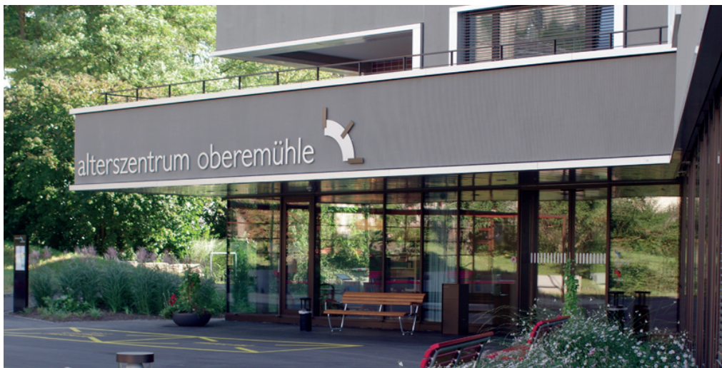
Das neue Alterszentrum Obere Mühle ist ein kräftiger, vieleckiger, fünfgeschossiger Solitär.

Weitere Artikel zur Geschichte des Alterszentrums Obere Mühle Lenzburg finden sich in den Neujahrsblättern von 2011 («Säulenträger der Betagtenbetreuung: 50 Jahre Verein für Alterswohnheime» von Heiner Halder), sowie in den Chroniken der Ausgaben von 2012, 2013, 2014 und 2015.