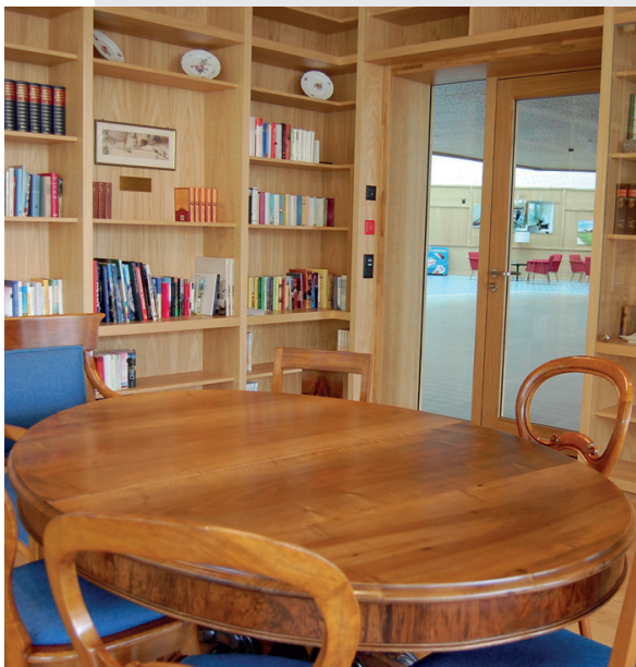
Das heimelige Hünerwadelzimmer.