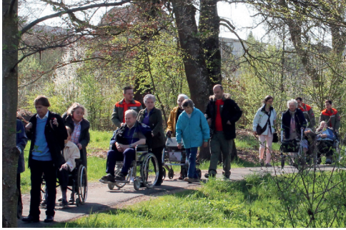
Die Züglete vom Provisorium ins neue Zuhause.