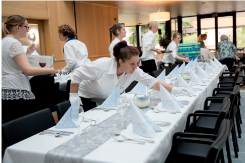
Vorbereitungen für das grosse Einweihungsfest.