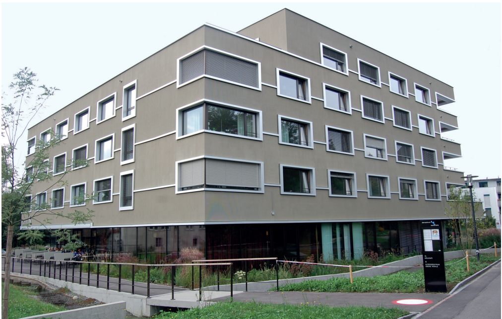
Die vielfältige Ausrichtung der Fassaden bewirkt ein Wechselspiel mit den umliegenden Gebäuden.