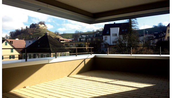
Weite Terrassen bieten schöne Aussichten.

Mit der abgeknickten Volumetrie und einer differenzierten Höhenstaffelung sind die einzelnen Fassadenabschnitte gut proportioniert und deshalb nicht übermässig lang und hoch, womit sich die äussere Erscheinung bestens in die städtebauliche Körnung des Quartiers einpasst. Der Solitär wirkt frei und nimmt dennoch Bezug zu den Elementen und zum Massstab der Nachbarschaft.