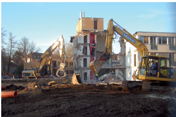
Der Altbau wurde Ende 2013 abgebrochen.

Im Einwohnerrat kam es angesichts dieser neuen unerfreulichen Sachlage im September 2012 zu regen Diskussionen. Die Solidaritätsbürgschaftsverpflichtung erhöhte sich mit der «Fahnenflucht» der Nachbargemeinden auf 8,42 Millionen, nebst dem unentgeltlichen Baurecht bis anno 2072. Obwohl die SVP die Projektvorlage aus Kostengründen zurückweisen und wieder von vorne planen wollte, stimmte der Einwohnerrat mit 28 zu 2 Stimmen und einer Enthaltung zu. Die Volksabstimmung wurde auf den 25. November 2012 angesetzt. Und noch vorher erteilte der Stadtrat bereits die Baubewilligung für den Abbruch des Altbaus sowie für Provisorium und Neubau.